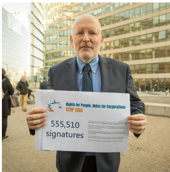
(Eurocommissaris Frans Timmermans - april 2019)

Tegelijkertijd, hebben een groot aantal slachtoffers die hun fundamentele rechten geschonden zien door multinationals geen toegang tot de rechter of tot herstelmaatregelen. De Europese Unie is bovendien geen echte voorstander van een bindend VN-Verdrag dat slachtoffers van inbreuken op de mensenrechten door transnationale bedrijven de mogelijkheid geeft om die bedrijven te vervolgen in het land waar de misdaden plaatsvonden of in het land waar de bedrijven hun hoofdzetel of substantiële activiteiten hebben. Een resolutie van Ecuador en Zuid-Afrika in 2014 bracht het initiatief voor dit Bindend Verdrag inzake Bedrijven en Mensenrechten op gang. Sinds 2016 wordt er hierover onderhandeld in de VN, maar de Europese Unie en haar lidstaten werken niet echt mee.