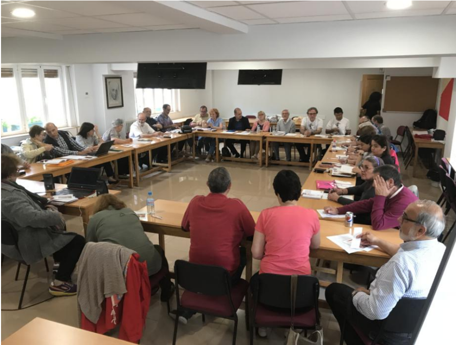
(Algemene vergadering in Madrid - 1-3 juni 2018)

De Spanjaarden met hun meer dan tien Romero comités lieten zich niet onbetuigd.